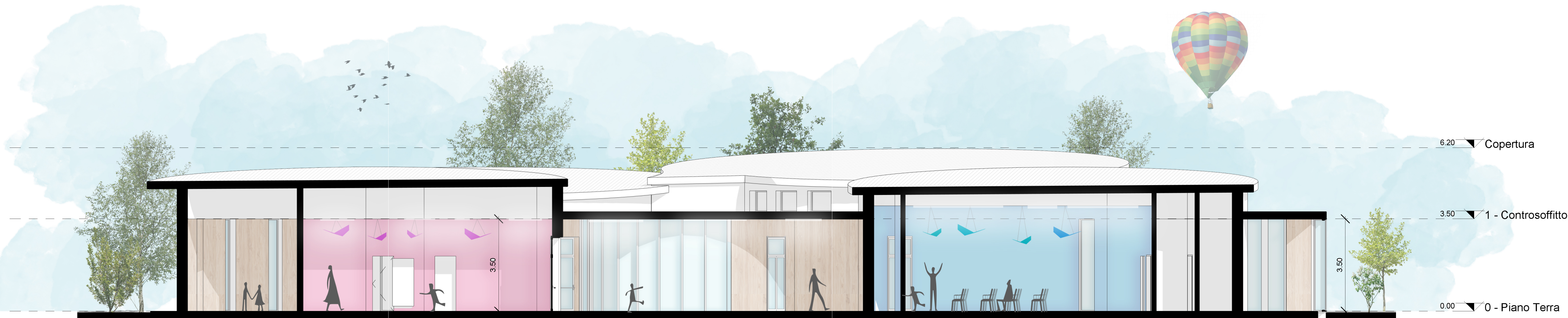
SEZIONE 3 - SCALA 1:100