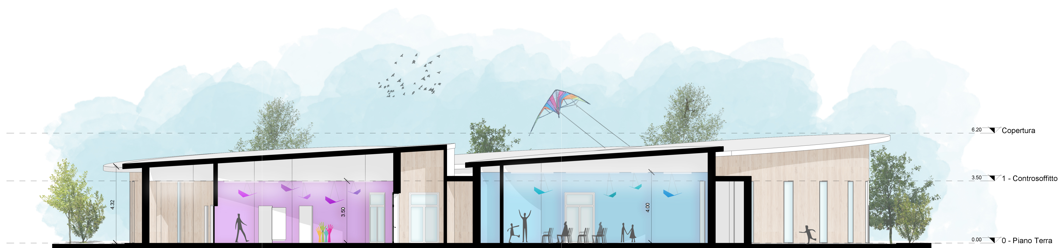
SEZIONE 2 - SCALA 1:100