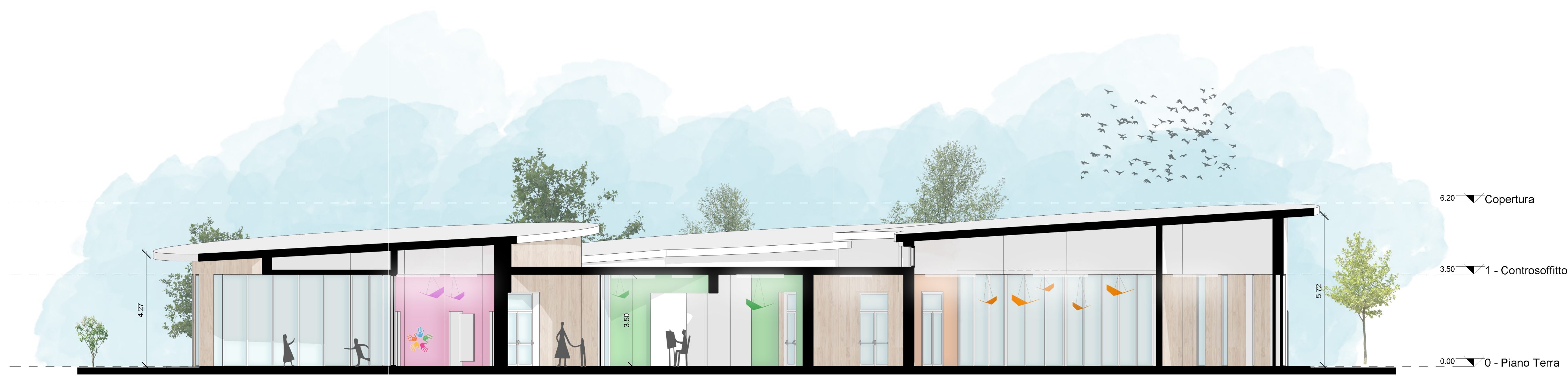
SEZIONE 1 - SCALA 1:100